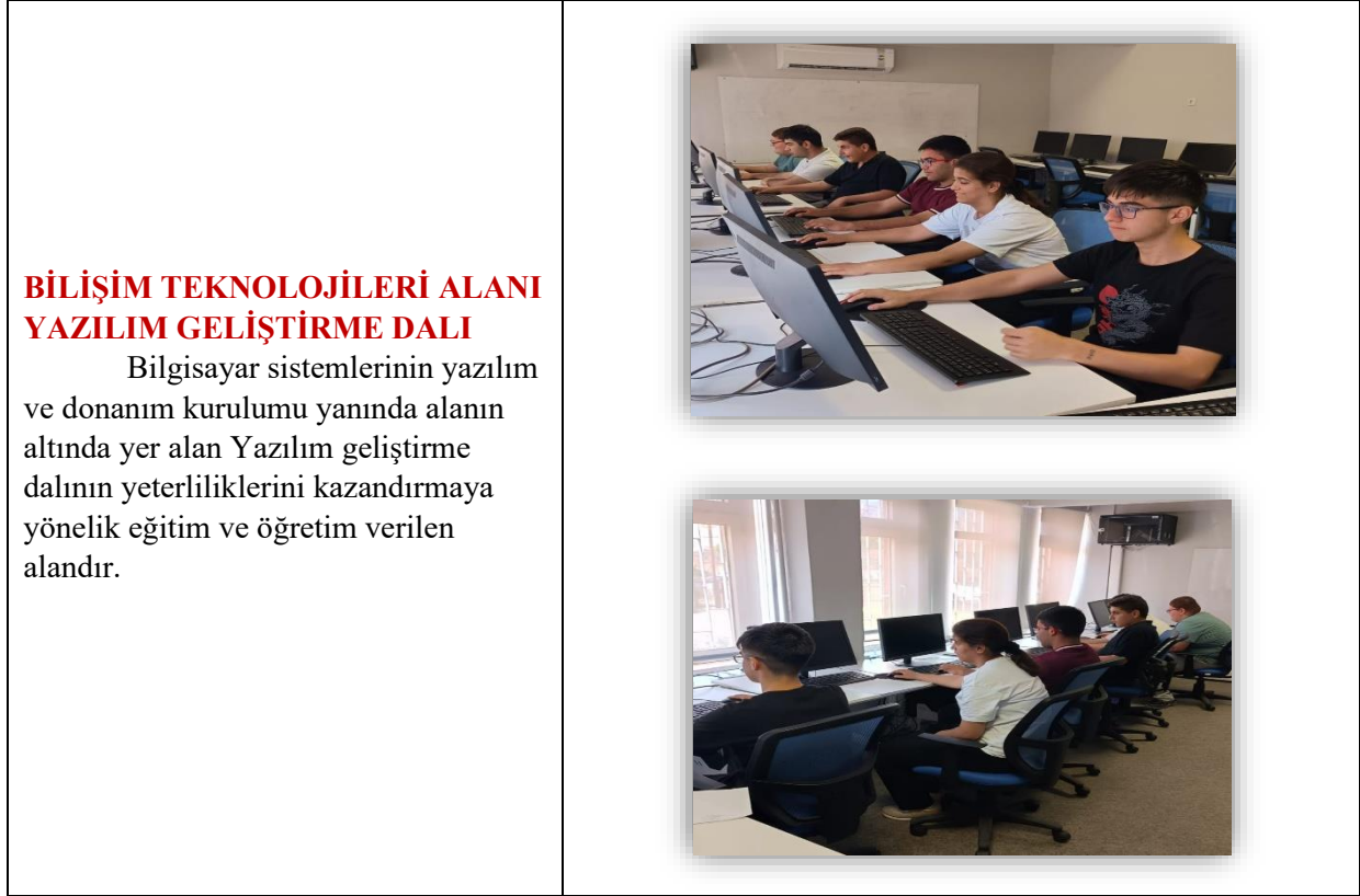
Tablo 6. Okul alanları tablosu