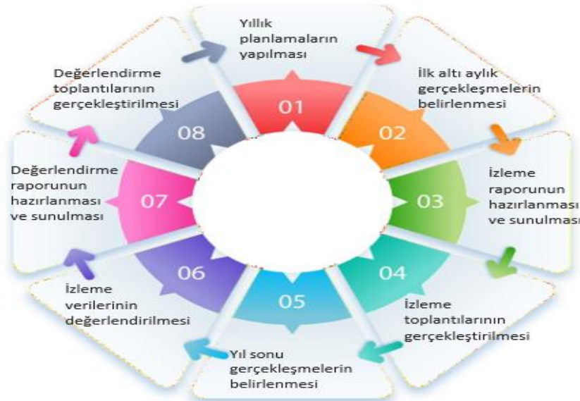
Şekil 2. İzleme ve Değerlendirme Süreci

Stratejik Plan izleme ve değerlendirme sürecinde hızlı ve güvenli veri akışını mümkün kılmak, mükemmeliyetçi olmak ve katılımı artırmak amacıyla her yıl Eğitim Öğretim yılı sonu ile 31 Temmuz tarihleri arasındaki süreçte müdürlüğümüzce hazırlanan raporlama araçları ile yapılacaktır. Elde edilen veriler sonucunda 31 Aralık tarihi itibarı ile izleme sonuçlarına yönelik değerlendirme yapılarak, negatif sonuçlar gösteren veya iyileştirmeye açık performans göstergeleri için, gerekli önlemlerin alınmasına yönelik faaliyetlerin artırılması sağlanacaktır.